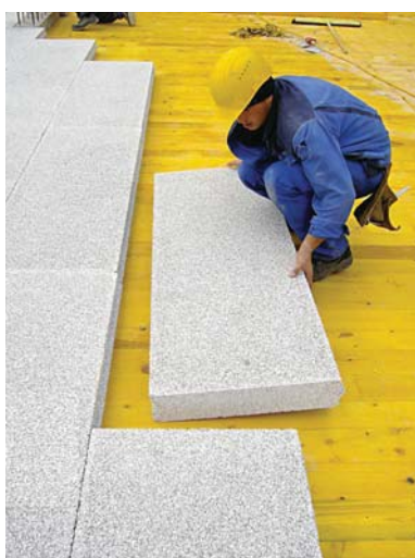
Vkládání do bedně

Vlastnosti 3i-izolačních desek zaručují trvalé spojení s betonem, takže není nutné žádné další mechanické kotvení.