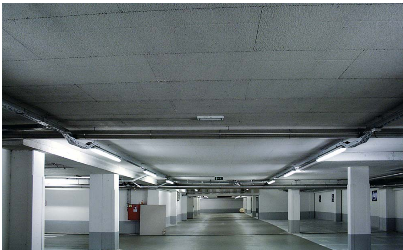
3i - stropní izolační desky vložené do bednění