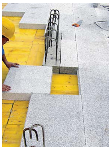
Betonáž bez přidaného kotvení